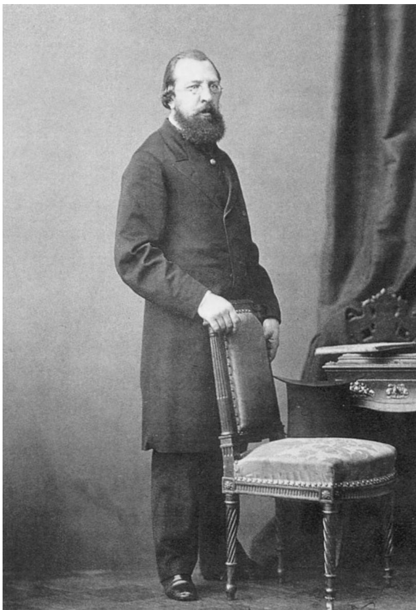
Иван Сергеевич Аксаков (1823 – 1886 гг.)